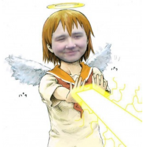
Пухлик и его луч любви .