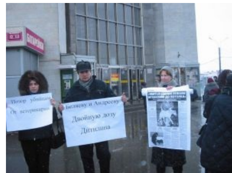
Зоофилы и Вещества.