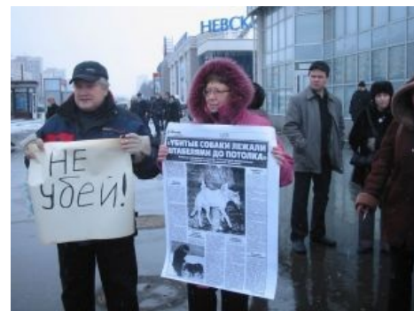
Поценты на фоне Питера.