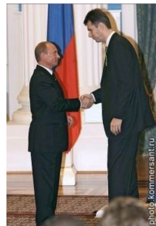
Прохоров даже на Путина смотрит... свысока .

Во время крысиса туева хуча олигархов, расширявших свой бизнес за счет кредитов, быстро стала нищевродами . Мишка же, учуяв лиса жопой, вышел в кэш и удачно сплавил аккурат перед пиздецом большую часть акций, ВНЕЗАПНО стал самым богатым человеком этой страны, хотя до этого мелькал в списке богачей где-то в задних рядах. Альтернативная, и более реалистичная версия, состоит в том, что Прохоров никуда не хотел выходить, но его отжал Дерипаска, купив на самом пике докритического пузыря акций и цен на природные ископаемые за почти рыночную стоимость. По слухам, именно вследствие такого мини-фейла, обернувшегося случайным вином, Прохоров почувствовал себя суперменом и начал страдать всякой фигней, типа стадионов в США, команд НБА, политоты и автомобилей, производя массу лулзов и фейлов одновременно. В 2010 году новый список богачей задвинул Прохорова на второе место. На Олимп вместо него взошёл Владимир Лисин. Fail . (Бытует мнение, что в список богачей попадают те, у кого не хватило денег туда не попадать).