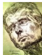
Портрет олигарха кисти совести нации