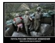
Посылка немного не доехала