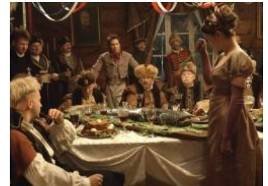
Шляхта изволит трапезничать фаршированной рыбой

Хотя и вышла демократия , но странная, как, в принципе, и римская, и греческая, где право голоса имела довольно маленькая кучка людей. А на дворе стоял XVIII век с его транспортной системой в виде грунтовых дорог, периодически превращающихся в непролазные топи , и средствами связи в виде гонцов. А решения важно было принимать быстро, чётко и без лишних споров. Монарх с абсолютной властью в руках был к этому отлично приспособлен и, пусть вершил дела не всегда верно, зато быстро. В отличие от польского Сейма, где на сбор депутатов, обсуждение вопроса, неизбежные срачи и принятие решения уходила уйма времени. А король, повязанный законами по рукам и ногам, никак не мог повлиять на ситуацию. Так могло продолжаться месяцами и в итоге привело к тому, что примерно за сотню лет с второй половины XVII по последнюю четверть XVIII вв. Речь Посполитая была уже просрана.