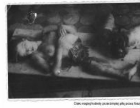
Небольшое гуро, устроенное на Волыни полякам бандеровцами

Немцы верят, что Польша на севере населена полярными медведями, а на юге — пингвинами, а её президентом является Дональд Дак. Также эта страна лидирует по количеству священников и является фактически фабрикой по их производству. Польский язык для немца звучит так, будто пьяный американец делает попытку прочитать на русском стишок, и ему в рот залетела муха. В Германии ляхи славятся своей вороватостью, причём считается, что пиздят они не только машины, но и всякую хуиту типа огурцов. Этот устоявшийся стереотип был справедлив 15-20 лет назад, когда Польша была гораздо более нищей, и повод воровать у богатой Германии был весомый. Сегодня чурки и негры,