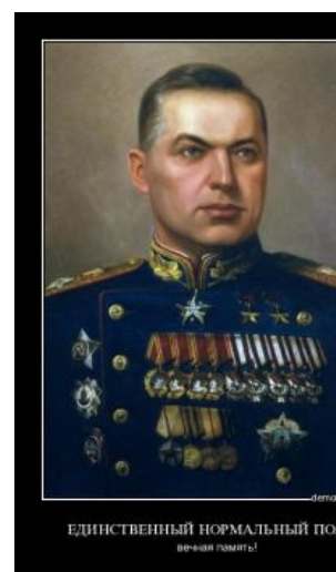
Герой ВОВ. А ты продолжай хейтить Рашку в интернетах