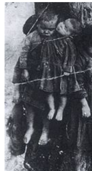
Тернопольское воеводство, 1943 г. Знаменитый венок из польских детей, по образу которого уже монумент открыли [1]