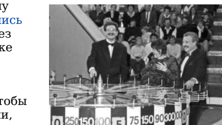
Ещё живой Влад, ещё молодой Якубович и всё такая же юморная Клара Новикова

Впрочем, о том, что Якубович — гондурас, многие подозревают уже давно. Например, в ток-шоу «Акулы пера» в 1996 году ему заявили открыто и смело : «Вы зазвездились, а к участникам передачи относитесь с плохо скрываемым презрением». Аркадьич выслушал эту тираду со взглядом бухого Свиборга, после чего ответил в духе «вы всё врётё, и, вообще, пипл хаваёт». Истина, как обычно, где-то рядом, но, во всяком случае, юмор у ведущего действительно бывает довольно специфический и местами напоминает жирный троллинг: