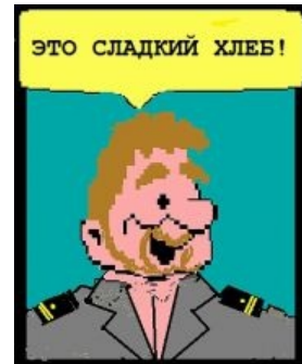
Пахом играет в «Поле Чудес»