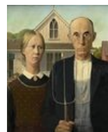
Древние унылые пиндосы смотрят на тебя как на раба.