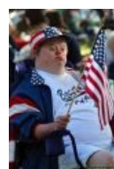
Он любит свою страну. А ты?!