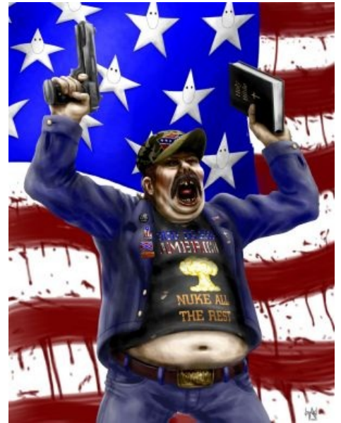
Pindos in a nutshell.

Пиндостан (Пиндостун, Пиндосран, Пиндосия, Соединенные Штаты Пиндостана\Пиндосии (СШП)) — довольно оскорбительные названия США. С частью «стан» все понятно — признак отсталой страны, а вот с Пиндосом поинтереснее. Впервые слово «Пиндос» попало в Россию через телерепортаж из Белграда, в котором наш солдат называл НАТОвских солдат — Пиндосами, впоследствии, пиндос стали применять только к Американским солдатам, а затем — и ко всем жителям США. Существует много версий происхождения слова, но самая правдоподобная — Сербская — дело в том, что по-сербски Пиндос — это просто «пингвин» [O RLY?] . Все очень просто. Если натовского солдата ранят а на нем не будет какой либо аммуниции ему не заплатят страховку, поэтому все натовцы в полном 40-килограммовом обмундировании всегда и везде. Ну и походочка соответствующая.