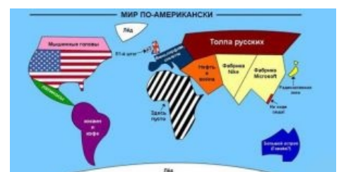
Мир глазами пиндосов.

Пиндосские журналисты такие географы (собственно говоря, по пиндосским понятиям, термином «средний восток» обозначается «ближний восток». То есть у них только два востока средний и дальний, а ближний используется редко и знают о нем немногие, ну ты понел). Обратим также внимание, что Ирак обозначен как Египет