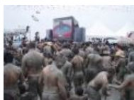
Типичные пиндосы на выпасе.