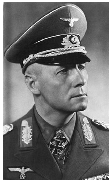
Роммель смотрит на пиндосов как на говно

Наиболее простой способ привлечь пиндоса состоит в следующем: постройте макет нефтяной вышки, разлейте канистру нефти и установите флаг любой расцветки и рисунка, отличный от звездно-полосатого. Можно также засеять небольшую делянку опиумным маком или коноплей. Очень скоро вы сможете