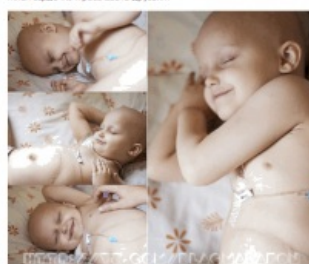
Стадия IV нейробластомы - широко распространенная опухоль с метастазами в лимфатических узлах, костях скелета, легких и других органов