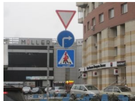
Кеглепережат в ДС2

мир не замечает. Окружающих пешеходов тоже не замечает принципиально. Чуть реже чем всегда считает себя и коляску со спиногрызом полноценным транспортным средством, отчего во дворах предпочитает ходить с ней только по проезжей части ( на самом деле , попытайтесь вкатить коляску с личинкой человека сначала одной, потом другой парой колёс на непониженный бордюр и делать это каждые 50 метров и поймёте). Любят сбиваться в группы, отчего вызывают ненависть не только водителей, но и других пешеходов: пара-тройка мам с колясками, идущих рядом, вполне способна как занять широченный тротуар, так и отхватить пару полос от автомобильной дороги. Свято уверена, что ее все всегда видят, включая сдающие задним ходом фуры и самосвалы. Люто ненавидима велосипедками.