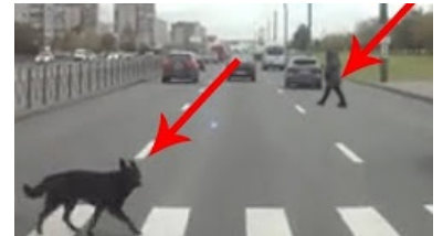
Разумное существо и пешеход переходят дорогу