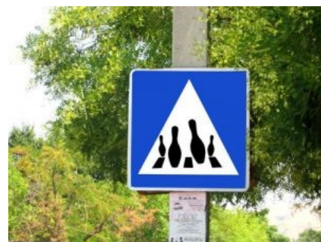
Места скопления кеглей в этой стране выглядят так

Все мысли только о любимом чаде, поэтому остальной окружающий