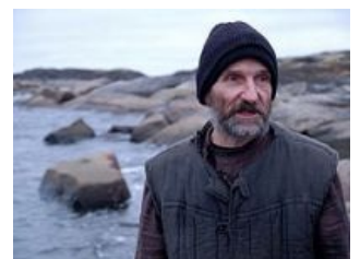
Кадр из «Острова»