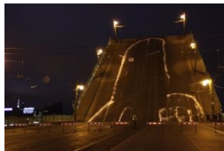
Тот самый эпичный рисунок

Аврора Крейсер — по одним данным, самая знаменитая еврейка Ленинграда, по другим — единственная девственница. Которая при уточнении оказывается кораблём Балтийского Флота, легендарным крейсером революции 1917 года. О том, как шестидюймовка авророва бабахнула по Зимнему дворцу, известно даже большинству нынешних школьников. Историки, правда, спорят, — шмаляла ли красавица «Аврора» холостыми, лишь давая сигнал к штурму и доводя на психику окопавшихся в Зимнем министров-капиталистов и юнкеров с бабьим батальоном. Или это был всё-таки реальный обстрел. Следует сказать, что упомянутый выстрел был уникален: все знают, что выстрел был один, но одновременно все знают про залп «Авроры». Между тем залп — внезапно по определению несколько одновременных выстрелов.