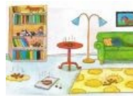
Вован на уютненьком