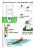
Путевка в жизнь