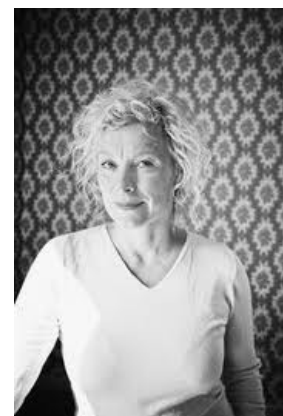
Ковер на фоне автора

Пернилла Стальфельт — расово шведская писательница и рисовательница детских книжек на различные жизненно важные темы, о которых взрослые предпочитают умалчивать, или пиздеть всякую хуйню. Темы Смерти , Любви , Толерантности , Говна и Насилия раскрыты с неповторимой непосредственностью, без лишних букв, но с массой довольно специфичных рисунков, как и положено в детской литературе. Швеция — это вам не тут , и Пернилла получила за свое творчество премию имени Астрид Линдгрэн.