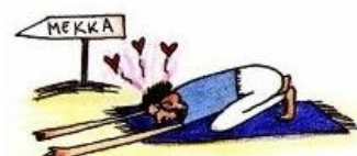
Любовь к Аллаху

Творчество хорошо известно в рунете и мало кого оставило равнодушным. Работает как детектор, безошибочно разделяя серую массу хомячков на либерастов (которые не видят ничего ужасного) и моралфагов (которые хотели бы сжечь всю эту ересь, проломить голову несчастной писаке чем-нибудь тяжелым, пустить кровь, кишки, распидарасить111). Вообще, проблема воспитания подрастающего поколения — та еще дисциплина специальной олимпиады, и своевременный вброс тетушки Перниллы способен разжечь макаренкосрач с новой силой. Пользуйтесь случаем.