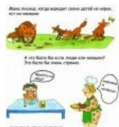
Я тебе принёс покушать