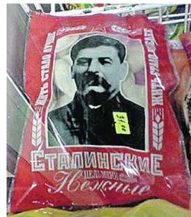
Пельмени для шмуклеров

Те, у кого таймер совсем плохой , включают не внутренний, а внешний (или засекают время на компе и следят за ним, если не увлекаются каким-нибудь думцом или писательством ). Таймер есть в 99,99% телефонов, у некоторых есть в электронных наручных часах (если их ещё кто-то носит не ради понта); в конце концов, можно незадолго купить кухонный механический. Да и чайник со свистком можно поставить не последовательно, а параллельно (главное — воды в него не забыть налить). Наконец, можно варить в стеклянной таре с крышкой в микроволновке. Сгоревшие пельмени, да и вообще любая испорченная по проёбу нямка — это вопрос не распиздяйства как такового, а нежелания напрячь МНУ на пару лишних секунд. Кулинар-кун гарантирует , что таймер, срабатывающий каждые 10 минут, — залог вашего сытного ужина, если на него не забывать . У настоящих кулинаров пельмени не успевают развалиться.