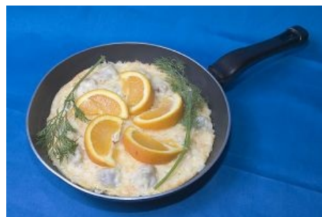
Пирог из пельменей с кетчупом, сыром и маянезиком , украшенный апельсинками и зеленью

Готовые пельмени выкладывают на тарелочку и... ждут минуту-две! Потом сливают вытекшую из пельменей воду, которую они набрали при варке (хотя для кого-то такая вода чуть ли не больший «деликатес», чем находившаяся в них еда, но это уже дело отдельных гурманов ), и только после этого заправляют соусами и сметанами (иначе вода попросту смоем начисто любой соус). Хотя некоторые любят есть пельмени с бульоном, пользуясь ложкой — получается что-то вроде этакого супчика (в этом случае рекомендуется сыпнуть чуть «Ролтона»).