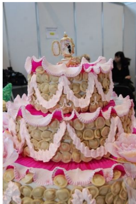
Торт из пельменей. С маянезиком

Если уж очень хочется проапгрейдить пельмени, то можно сделать к ним типа соус: уксус, черный молотый перец, соль и сахар (чуток). Наливается в тарелку по вкусу, сверху сметана или сливочное масло. Можно добавить еще мелко порезанный сырой репчатый лук. Также неплохой соус получается, если смешать кетчуп с пресловутым маянезиком в равных пропорциях. Для тех, кто устал от бесконечного майонеза, можно сметану в пропорции 1:1 и добавить чеснока, даже вкуснее получится. На Урале и Сибири часто пользуют смесь уксуса столового, горчицы острой и молотого черного перца — в нее окунается пельмень перед отправкой в рот, но тру-сибиряки сначала откусывают небольшую дырочку в пельмене, а затем этим отверстием зачерпывают уксус, для того,