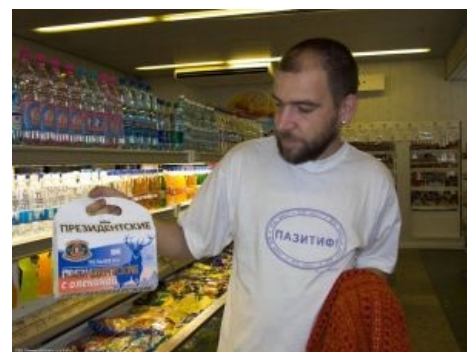
Апач и президентские пельмени с оленем

Несмотря на улучшение качества пельменей промышленного изготовления, среди небыдла расово верными и кошерными считаются лишь пельмени, вылепленные дома, с применением