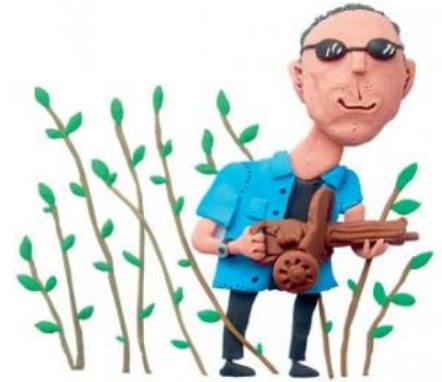
С глиняным пулемётом