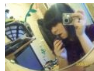
Педофки на сайте знакомств