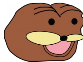
Наиболее часто встречаемое изображение