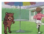
Педведь ловит лоли