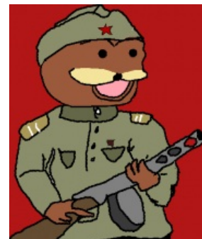
Солдат с ППШ