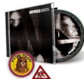
Педодиск русского рока