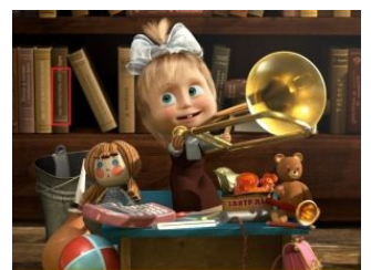
Маша патчит KDE