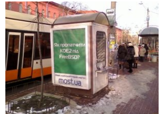
Рекламная стойка в Киеве возле Национального университета Шевченко