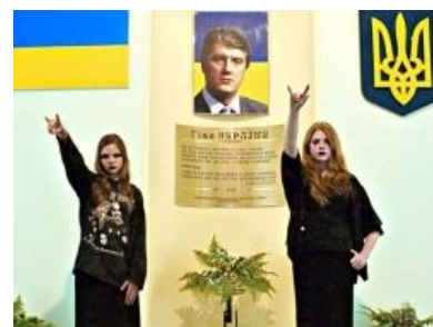
Пасечник на фоне украинских готэсс . Мировое сообщество тихо фалломорфирует.