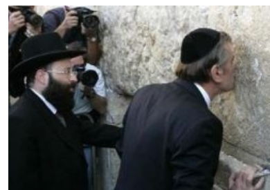
Укростанский «националист» в окружении «любих друзів»