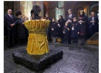
Ющенко участвует в таинственных и страшных культурах