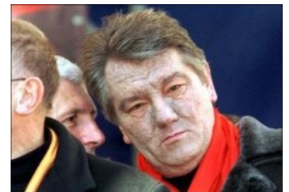
Смотрит как-то недовольно, свирепо и в то же время грустно и недоумением .