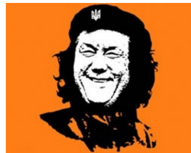
Таким его хотят видеть фофудьеносцы