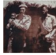
Че в Конго