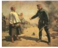
Мать партизана. Герасимов. За власть Советов. Эпичная советская пропаганда