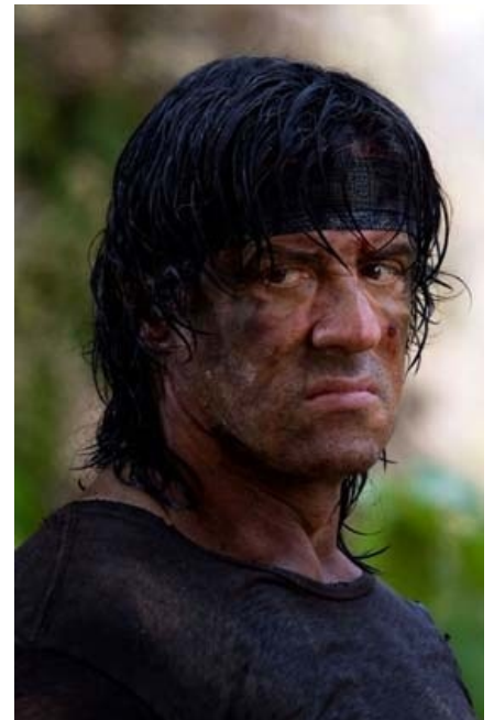
Обыкновенный бирманский партизан смотрит на тебя как на врага свободы и демократии

Вид партизанщины, распространённый в Латинской Америке. Собственно, там это практически национальный вид спорта, в котором латиносам нет равных даже среди заирских негров и бирманских азиатов — ведь здесь это любимая форма протеста ещё с колониальных времён: лесов и слабозаселённых территорий полно, а власть дотянуться в глухие джунгли как не могла двести лет назад, так не может и сейчас, даже имея американские вертолёты и американских же инструкторов. Из-за этого партизаны могли десятилетиями ныкать по лесам, отстреливая патрули. Но рекорд установили, как ни странно, филиппинские партизаны-мусульмане , воевавшие с центральным правительством с конца 1960-х по 2008-09 годы.