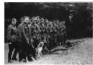
А это тру бандеровские партизаны и их песик