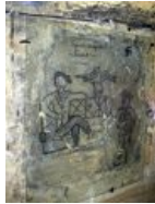
Творчество одесских партизан