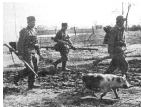
Дойче зольдатен ловят укро- партизан на живца