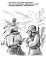
Боян в тему