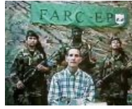
Колумбийские партизаны и их гость. Похожи вот на этих ребят?