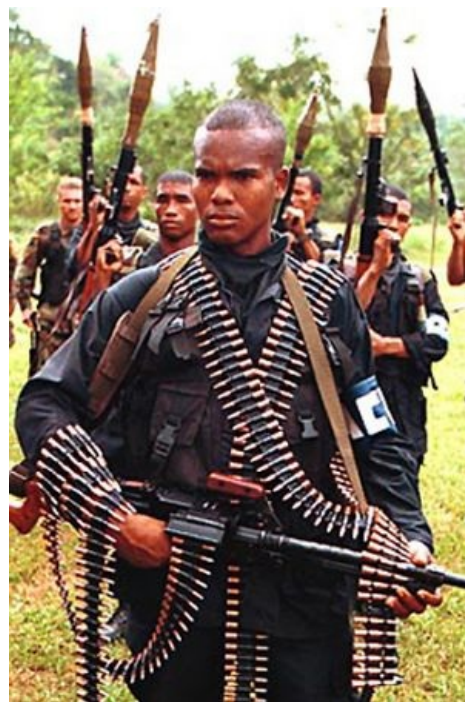
Брутальный парти... вовсе даже не партизан, а борец с ними

Те самые южновьетнамские партизаны, которым помогали с севера. Поскольку янки были на голову лучше вооружены, партизанам приходилось придумывать всяческие военные хитрости и подлости, и просто сюрпризы для увеселения прогуливающих по джунглям американцев. Для изготовления мин и фугасов взрывчатое вещество часто добывалось из неразорвавшихся американских снарядов и бомб. Помимо этого, древневьетнамская охотничья смекалка порождала самые изощрённые ловушки. Тут вам и замаскированная яма с бамбуковыми кольями, которые вьетнамцы, к слову говоря, не гнушались мазать собственным говном; и «Вьетнамский сувенир» — прикрытая листьями ямка с металлическими штырями, попадая в которую, солдат гарантированно лишался ноги; и змея на верёвочке в тоннелях, от которой