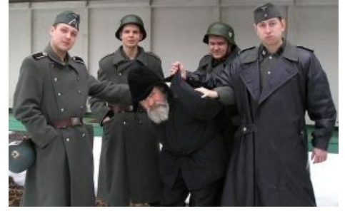
Поймали партизана бомжа