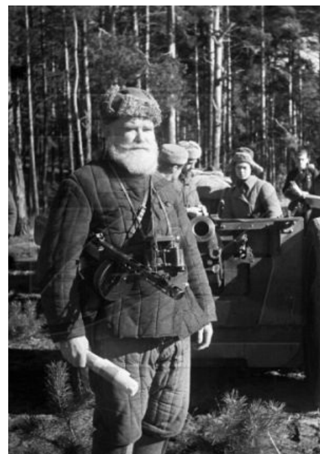
Эталонный русский гварильеро на подступах к Палате мер и весов

Не все понимают, что, вообще говоря, партизаны, в силу особенностей ведения партизанской войны, чуть реже чем всегда считаются военными преступниками, поэтому и отношение к ним обычно соответствующее . В принципе, партизанская война не является незаконной сама по себе (и даже статус партизана является официально признанным Женевской конвенцией), но для того, чтобы считаться законно сражающимся бойцом («комбатантом»), партизану необходимо соблюдать пять условий: