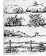
Как правильно маскироваться