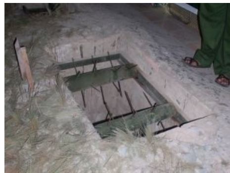
Эталонная вьетнамская ловушка