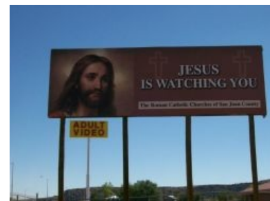
Jesus is watching you

Ясно одно: от нас что-то скрывают . Согласно разновидности паранойи — «спецслужб», единственными реальными происками являются происки исламских террористов. Утверждение же, что «все эти происки в конечном счёте являются происками ZOG» — пример тотальной паранойи с доминантой «паранойи масонов». Укоренения Древа Бреда с таким мощным корнем — тяжёлый случай, не пролечишь.