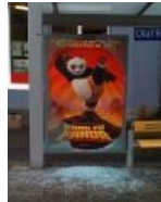
Haters gonna hate