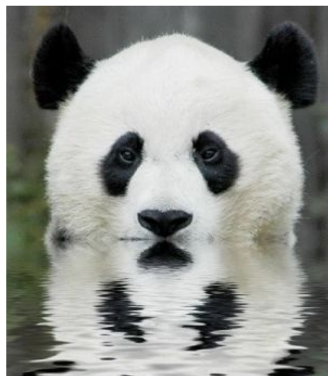
Погладь меня, сука!

Кстати, не всегда панда добра: известны случаи, когда панда ест, стреляет и уходит — об этом и в энциклопедиях написано: