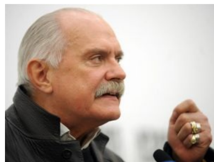
Никита Михалков. Хочет быть баринoм всея руси. Обещает любить и хорошо кормить своих холопов. Очень боится, что после «ассимиляции» никто этого не захочет.