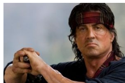
Кино про Рэмбо — учебное пособие по западному мышлению

Самое массовое и известное проявление сабжа в его клинической форме произошло в августе 1991 года, во время путча, когда на улицы высыпали толпы людей, желающих окончательно уничтожить совок в этой стране. На