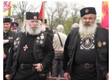
Православные хоругвеносцы: мы христианутый мир построим!