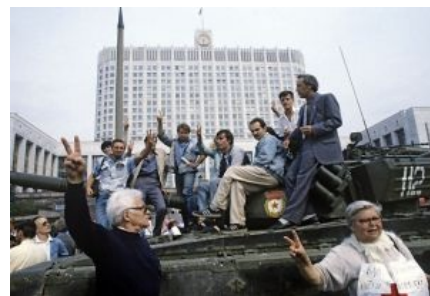
Август 1991 года: небыдло участвует в развале совка

Так и не избавившись от своей подсознательной руссофобии , такие поцреоты продолжают во всем подражать всяким христианским фундаменталистам из Америки. Притом подражание это происходит с трогательной точностью. Американские политфрики любят писать книжки о вреде рок-музыки и субкультур; о том, что Мадонна — сатанистка; о том, что компьютерные игры, гомосексуализм, интернет, аниме и толерантность внедряются в