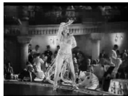
Кадр из середины

Однако кроме необходимых потребностей были и другие, которые советский госплан упорно не желал удовлетворять. Либеральным диссидентом мог стать выходец откуда угодно, но именно человек из номенклатуры как никто другой видел недостатки бюрократической системы и имел простые причины