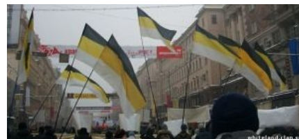
Ымперцы требуют светлого прошлого