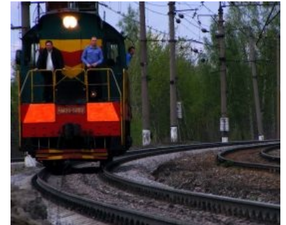
За Вами уже выехали!

Типичные вохры в процессе высматривания вражеских шпионов