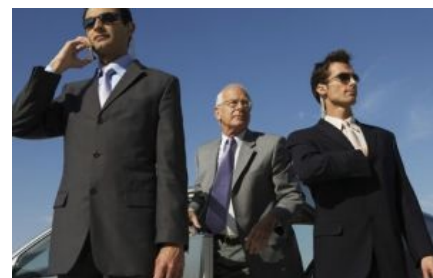
В своих фантазиях...