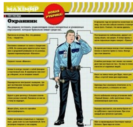
Эталон из палаты мер и весов

Не ЧОП, а подразделение Росгвардии (до 2016 — полиции ), занимается охраной разных объектов и личного имущества граждан. Кроме того, эти парни занимаются тем же, чем и обычные рядовые ППС-ники — периодически проверяют людей в розыске, пизнут нахуй никому не нужные рапорты , опиздюляют бомжей и т. п. Вооружены ПМами, иногда АКСами, одеты в бронежилеты. Иногда даже бывает, что в структуре этой охраны есть самый настоящий кинолог со своим питомцем . Кроме нарядов,