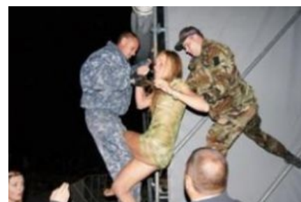
Они четко следуют принципу ББПЕ

https://www.youtube.com/watch?v=z8UM1TTVHss Рабочий день сабжа