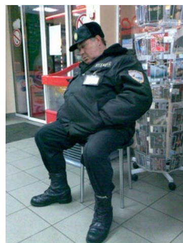
...и в реальности