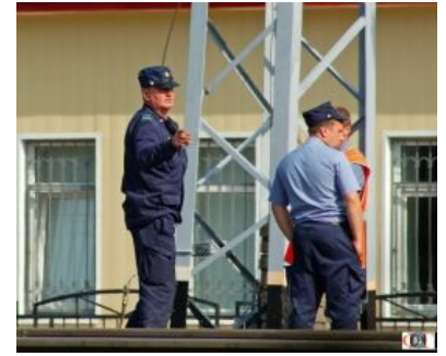
Типичные вохры в процессе высматривания вражеских шпионов

Эталонные представители бесполезных людей . Условно их можно поделить на тех, которые ошиваются в супермаркетах, и тех, которые сидят в разных муниципальных учреждениях. В супермаркетах необходимы исключительно для морального довления на потенциальных малолетних, маргинальных и прочих воров, так как никакого физического воздействия на них оказывать не имеют права. Несмотря на это, регулярно пренебрегают законными методами, получив свою толику власти . Знамениты постоянными избиениями всех, кого они подозревают в воровстве, или тех неугодных, на кого укажет начальство. Чаще всего набираются из эталонного быдла, живущего по понятиям и которому «в падлу» нормально работать, а также из престарелых отставных служаков, из которых армия выбила всю способность мыслить. Часто, помимо охранной деятельности, подрабатывают заказным запугиванием и грабежами. Единственно возможный метод взаимодействия с