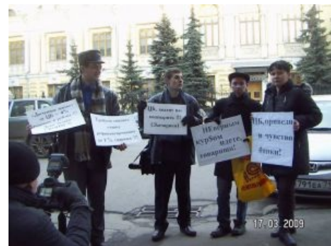
Лоханувшиеся лузеры уныло пикетируют Центробанк