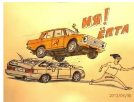
Советский автопром против российского. 228 детектед