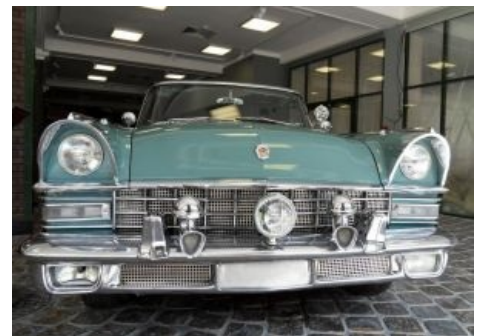
...и старший брат — Зил-111. Найдите пять отличий