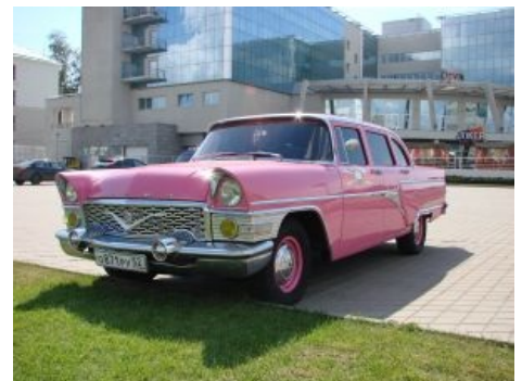
Чайка такая чайка