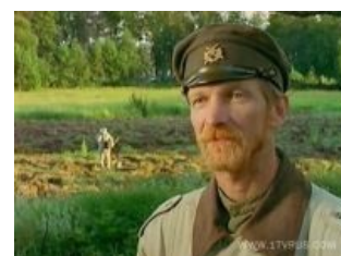
Кузьмич в новом прикиде.

Особенности национальной охоты (фильм о фильме) Воспоминания команды о первой и второй частях, любителям обязательно к просмотру.