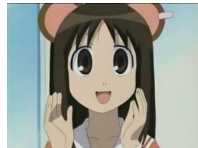
Осака с медвежьими ушками .

Касуга Аюму (moon. , Kasuga Ayumu ), или Осака (moon. ) — одна из главных героинь аниме Azumanga Daioh . Отличалась исключительной тормознутостью, крайне извращённой, но столь же изощренной логикой и неуёмной фантазией. Тем и знаменита. Стоит отметить, что она далеко не тупая, как думают некоторые быдло-куны . Интеллект Осаки развит и могуч! Просто из-за слишком медленной его работы, вызванной чрезмерной рассеянностью внимания Осаки, это не слишком заметно. Особый её талант — знание лунных рун.