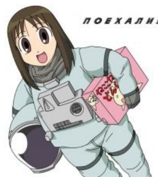
Богиня прокладывает человечеству путь в космос

Бытует мнение, что Осака — второй человек после Лейн Ивакура , на которого не распространяется правило 34, но как и в первом случае — оно в корне неверно . Также достоверно известно, что ичанеры фапают на Осаку, что нашло отражение в баннере Ычана.