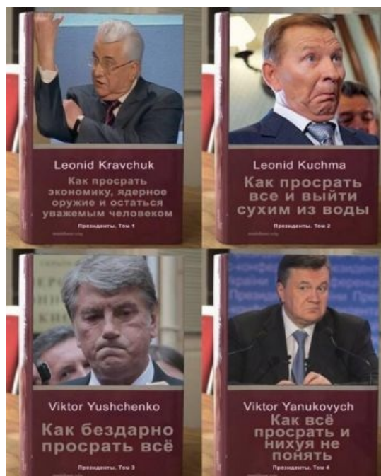
как все просрать.