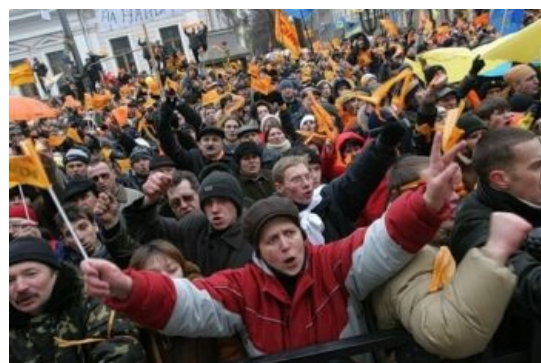
Оранжевые овладевают свободной Украиной.

Еще сильнее все обострилось после второго тура, когда Профессора объявили президентом, а Путин поспешил поздравить его с удачно провернутым делом. ВНЕЗАПНО , охуев от постоянной брехни власти и постоянного искажения воли избирателя, люди вышли на улицы, тысячи их. Самое большое собрание ( over900000 ) протестующих имело место в центре Киева и получило название Майдан . Большое распространение получили ленточки из ткани и полиэтилена оранжевого цвета, которые носили все, кому не лень, и вешали, куда не лень, даже в футболе — в финале Кубка Украины команды использовали символику, диаметрально противоположную политической — «Шахтер» в оранжевых цветах, большинство фанов из Донбасса, за бело-голубого Профессора, и «Динамо» в бело-голубых цветах, фаны —