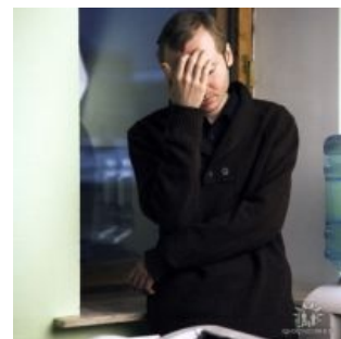
Поциент как бы спрашивает сам себя: что он тут делает?