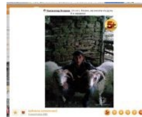
Фотография, размещенная в полном соответствии с требованиями

— Требования к фотографиям доставляют. Похожие требования есть и у Facebook'a