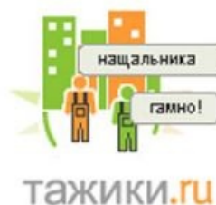
И еще одна