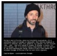
Сергей Брин — один из основателей Google. Известен своим юмором и любовью к технологиям.