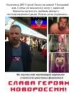
Изображение с надписью «САВЯ ГЕРОЯМ НОВОГОСКИИ!» и фотографиями людей.