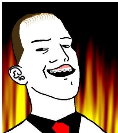
Самое крутое в поджогах — это не сгорать заживо, а показывать всем в онлайнe, что я это делал .

— « Прощайте, господа... менты убили меня! »