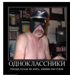
А чего добился ты?