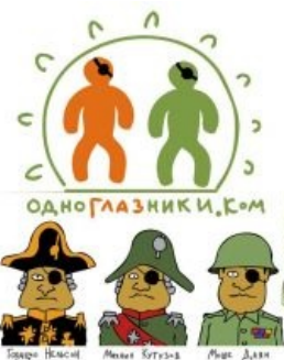
Одна из пародий на лого сайта

Если на фотографии кроме Вас изображены другие люди,