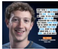
Марк Цукерберг — основатель Facebook. Известен своим предпринимательским талантом и влиянием на мировую социальную сеть.