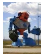
Огромный боевой человекоподобный робот такой огромный (ТИС-1КБ)