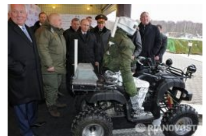
Путину показывают прототип БЧР [1]