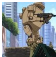
Советский меха — самый меховой меха в мире