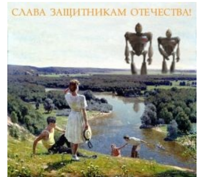
Огромные роботы так огромны и так человекоподобны

В январе 2015 года Путину таки продемонстрировали образец боевого человекоподобного робота, правда, пока не огромного. [2] Ждём, пока вырастет .