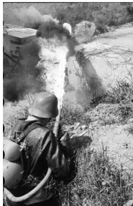
BURN, BABY, BURN!

«Think for a moment about the concept of the flamethrower. Okay? The flamethrower. Because we have them.[...] And what this indicates to me, it means that at some point, some person said to himself, "Gee, I sure would like to set those people on fire over there. But I'm way too far away to get the job done. If only I had something that would throw flame on them." Well, it might have ended right there, but he mentioned it to his friend. His friend who was good with tools. »