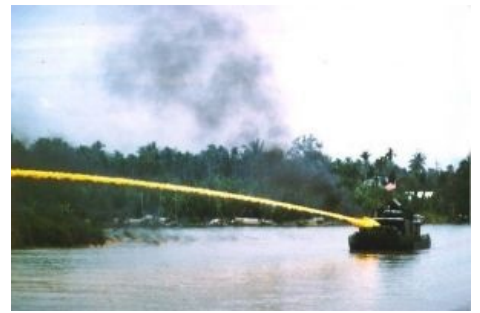
Плавающий сабж несет демократию

А во время Вьетнамской войны пиндосты ставили огнеметы на катера, которые несли демократию в прибрежные джунгли. Советы ограничивались снабжением гуманитарными огнеметами партизан в джунглях, которые были успешно применены на мирных жителей деревни Дакшон.