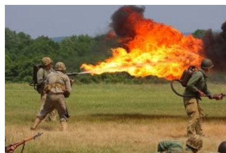
Раньше и трава была красивее, и огнеметы

На пересечении римской и греческой цивилизации, в Византии, благодаря афинскому философу Проклу классические греческие огнемёты опять нашли своё применения в V—VI веках на море (отсюда название — πύρ θαλάσσιον ) с использованием составов с серой (подобные использовались и в Китае вплоть до XIX века), и ещё больше распространились после изобретения в 672 году архитектором Каллиником смеси (т. н. πύρ κολλητικόν ) с использованием сырой нефти, сосновой смолы или канифоли (в роли загустителя), серы, животного жира, дёгтя, а также негашёной