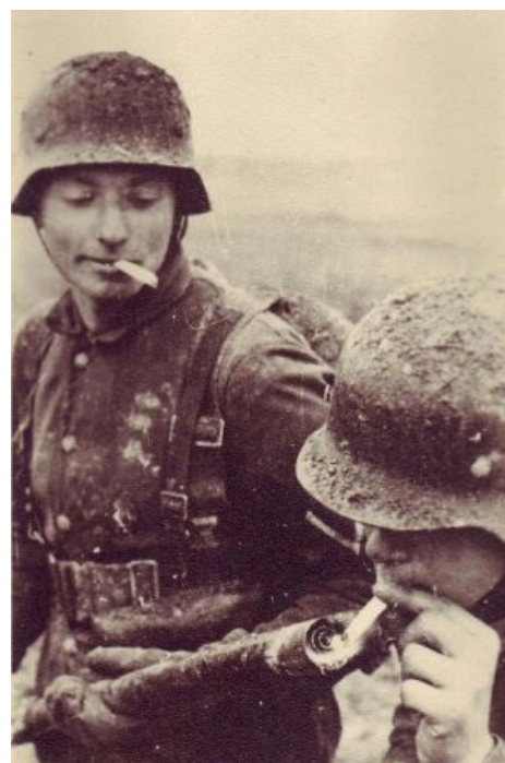
Hans! Get ze Flammenwerfer!

Выжигаем снайперов (Осторожно, не для впечатлительных)