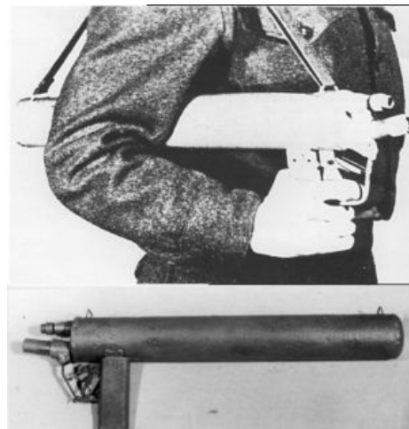
Einostossflammenwerfer 46. Ручной одноразовый огнемёт. Как он помог бы в пробках на дороге!

Также огнемёты в годы войны ставили на танки , которые жгли в промышленных масштабах, за что их крайне не любили пехотинцы, и