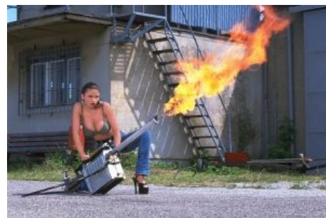
Огнемёт — это ещё и эротично