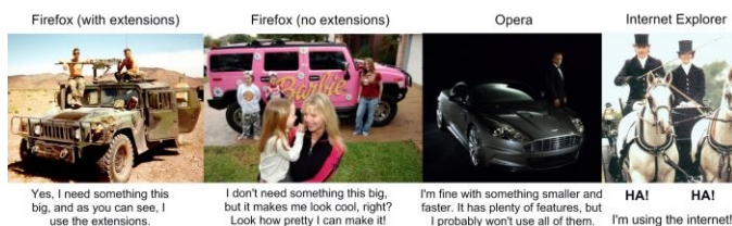
Сравнение самых популярных браузеров из 2008 года. Кто сказал универсальность?

«Собрала операционка все браузеры и строго говорит: Предупреждаю! Любого, кто будет чрезмерно жрать память, сразу буду бить по наглой рыжей морде!»