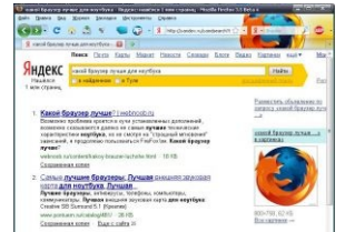
Яндекс как бы намекает.

Начиная с версии 3.0 огнелис (русской версии) продался Яндексу. В связи с этим у анонимуса прибавилось геморра с изменением поиска по умолчанию, домашней странице и винрарного автопоиска при наборе искомого текста в поле для URL, который при нахождении высокорелевантной страницы сразу же переходил на нее, минуя страницу поисковой системы.