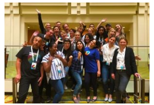
Современная команда разработчиков. DIVERSITY 100%

К этому времени AOL, купившая Netscape, отгрынула непереваренный Navigator, который пережил второе рождение как сабж. Так начала свою историю всем известная Mozilla. Корпорация зла предложила Мазиле перейти на тёмную сторону за печеньки и несколько сотен миллионов долларов ежегодно. Требовалось одно: трясти башкой в комитете W3C, поддерживая гугловые RFC (черновики стандартов). Чтобы сделка не выглядела настолько проститутской, формально Мозилла получала эти деньги за то, что устанавливала Google поисковой системой по умолчанию [2] . Очень скоро Microsoft обнаружила, что больше не может влиять комитетом W3C как собака хвостом, а вынуждена с опозданием реализовывать то, что придумал Google и одобрили Mozilla и Opera.