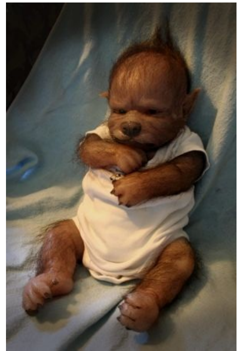
ОН SHI--(спойлер: кукла)

Оборотни бывают двух видов: те, которые превращаются в зверей по своему желанию, и те, кто болны ликантропией — болезнью превращения в животных. Отличаются друг от друга они тем, что первые могут превращаться в животных в любое время дня и ночи, не теряя при этом способности мыслить по-человечески разумно, а другие только ночью (по большей части в полнолуние), помимо своей воли, при этом человеческая сущность загоняется глубоко внутрь, освобождая звериное начало . При этом человек не помнит, что он делал, будучи в зверином облике. Основной причиной, по которой обычный человек может стать оборотнем, считается укус или рана, причинённая другим оборотнем. После чего укушенному человеку ничего не остаётся, как в ближайшее полнолуние обратиться в зверя. Утром к нему вернётся человеческий облик , на следующую ночь всё снова повторится, и так далее. Либо, как вариант, он отправится на постоянное местожительство в лес .