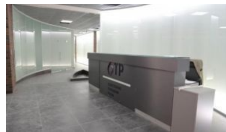
Дешёвый ремонт — такой дорогой

После старта не прошло и пары месяцев, как Лысенко заявил, что бюджет ОТР полностью исчерпан, а это 1,5 млрд рублей. «На что ушли казённые деньги?» — спросите вы. На ремонт . Новый телеканал отхватил половину 3-го и 4-го этажей АСК-3 (второе здание телецентра «Останкино») и сделал там действительно ахуенный ремонт в стиле хипстерских кафешек повышенной элитарности; там же разместились студии, эфирный комплекс etc. Оборудование для эфира вместе с обслуживающим персоналом было взято в бессрочную аренду у одной известной в узких кругах телецентра компаний .