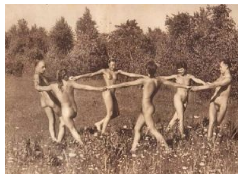
До сталинизма делегации нудистов из СССР были самыми многочисленными

Как за бугром, так и в странах СНГ не прекращается бурление говн на тему голых детишек, но пока что все попытки ограничить нудистов успешно терпят крах ( пруф ). Недобитые моралфаги срут кирпичами, а нудисты расслабляются на новозахваченных пляжах. В