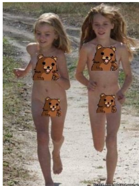
Гермиона очень изменилась за лето...