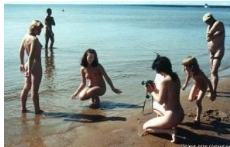
Группа нудистов на диком пляже

«При этом нагота девушек не заключала в себе ничего дурного, ибо они сохраняли стыдливость и не знали распущенности, напротив, она приучала к простоте, к заботам о здоровье и крепости тела, и женщины усваивали благородный образ мыслей, зная, что и они способны приобщиться к доблести и почёту. »