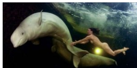
Она сделала это!