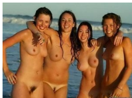
Вид на море на фоне нудисток