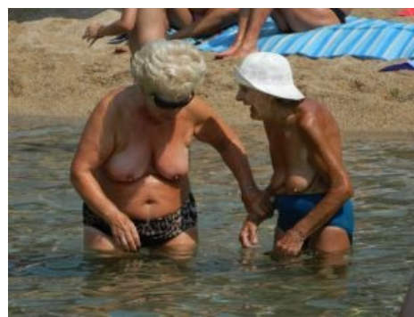
Это прекрасно же!