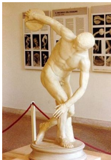
Тот самый дискобол Мирона

Нудизм современный зародился в Германии в начале XX века под названием «культура свободного тела», ИЧСХ , имел место до объединения Германии и был для восточных немцев тем, чем в Союзе был КСП . В конце XIX века участники тайных сообществ «Валгалла» или «Гелла» собирались в костюмах от Адама и Евы на частных квартирах и в загородных виллах. Как ни странно, но на первое место активистами в то время выставлялась вовсе не нагота, а здоровый образ жизни: отказ от алкоголя , курения и мяса . Именно тогда, на почве морального разрыва шаблона , обильно удобренного набирающим силу нонконформизмом, потянулись к солнцу чахлые ростки первых веганов.