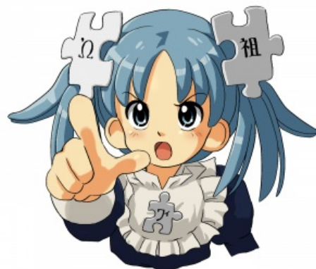
Википе-тян какбэ намекает