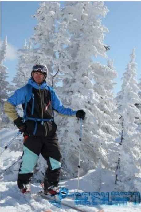
Из палаты мер и весов (спойлер: Новодел. Постановочное фото)

фотографировались, и в массе своей в одной позе — одна рука уперта в бок, вторая отставлена и упирается на лыжную палку, которую (лыжную палку) говномыльницы тех времен передавали довольно слабо. От горнолыжников словечко переняли проходящие мимо в горы альпинисты, от них мем ушёл к водятлам, далее везде. Среди хикки-задротов мем получил известность с началом издания серии «Для чайников».