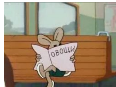
Заяц — первый советский двачер

Заяц — хиппи на советский манер. И никаких « лолшто »! Ибо всегда весь такой позитивный, жизнерадостный и никогда не унывающий . Кроме того, любит тусоваться на природе, выращивает цветы и периодически играет лапами в барабан в парке. Чем не хиппи? Род занятий — видимо, творческий, ибо имеет отношение к шоу-бизнесу (телевидению и цирку). В отличие от вероятного прообраза — Джерри, садистских наклонностей лишён начисто. Но за себя постоять не промах. Тем не менее, порою готов прийти на помощь Волку, влипшему в очередную историю. По иному мнению, Заяц до тошноты правилен, этичен , в большинстве случаев — рационален. А тролли и мудаки вообще считают его существом женского пола. Что объясняет все неудачи Волка. Так как с букетом роз и бутылкой сидра на экране, при тогдашних законах, Волк мог прийти только к хорошо знакомой зайке. Дефолтный вариант трактовки вполне логичен и несёт лулзы несметные — Волк просто хотел съесть его романтично, чтобы тому не так обидно было исполнить наконец Великое Экологическое Предназначение. В конце концов, ведь это действительно самый знаковый момент в заячьей жизни — так почему бы и не обставить его хотя бы как следует? Однако альтернативно одарённым всё нипочём.