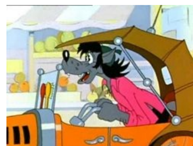
Подобные чудеса автопрома можно было собирать по журналу «Сделай сам»

The Doors & Ну погоди! The Doors «Break On Through»