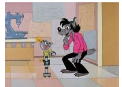
Мёрфи, это ты или не ты?

Множество зверья занято в эпизодах. Причём, кроме животных, символизирующих как бы людей ( антропоморфное зверьё обладает человекоподобным телосложением, разумом и носит одежду), встречается и реальное зверьё неразумное, то есть у животных есть свои питомцы. Мало того, в некоторых выпусках встречаются и конкретно люди! О людях сказано подробнее в разделе « Интересные факты ». Медленный просмотр первого выпуска даёт потрясающие результаты: оказывается, множество зверей просто не успевает попасть в поле зрения. Например, когда на Волка падает забор (при этом задним концом трезубец должен был проткнуть волка!), за ним паникует компания, которую невозможно разглядеть при обычном просмотре. Остановите плёнку (плеер или воспроизведение в YouTube) и увидите смешную картину... Особенно хороши сисястая тощая Лиса и глупый тинейджер Гусь.