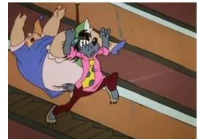
Свинопанцшот — а-ля «бабушкины рейтузы»

В СССР, на столике у входа в аттракцион/зрительный зал/музей стояла длинная игла на подставке, использованные билеты и чеки было принято не бросать на пол, а накалывать на неё. Точнее, так были устроены советские магазины: ты высматривал что тебе надо на прилавке, отстаивал очередь в кассу, пробивал там свои "три-шестьдесятдве в кондитерский", отстаивал очередь к прилавку, отдавал чек, получал искомое, чек продавщица накалывала на иглу для отчетности. В местах типа кино и аттракционов обычно ничего никуда не накалывали, контролер отрывал у билета талончик "контроль", а билет надо было сохранять до выхода и только потом кидать на пол. Носорог с билетами на роге - отсылка к киноштампу "рррреволюционный матрос на посту у Смольного накалывает мандаты на штык", гулявшему по к/ф типа "Ленин в Октябре" и ему подобным