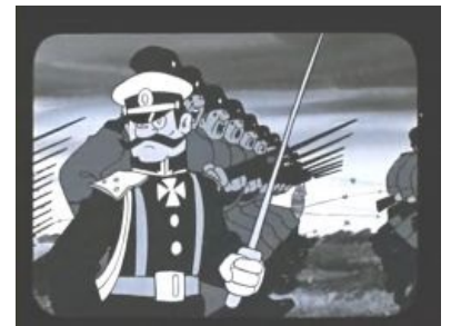
Кадр из сабжа с участием людей