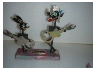
Вот так, примерно.