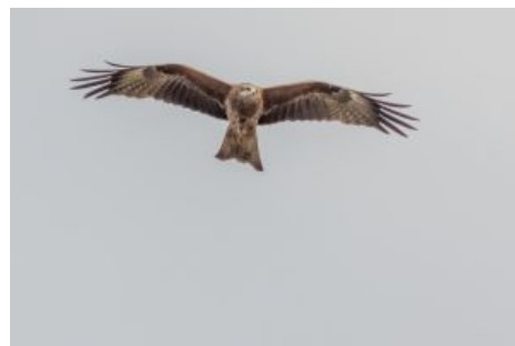
Типичное летнее небо в Новосибирске.