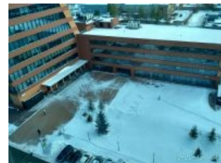
Высокодуховные жители культурного пригорода Новосибирска недовольны уборкой снега