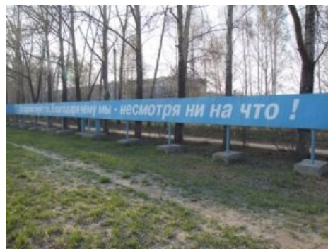
Известный новосибирский мем, улица Петухова.