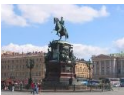
У болотоградцев есть хороший, годный памятник сабжу