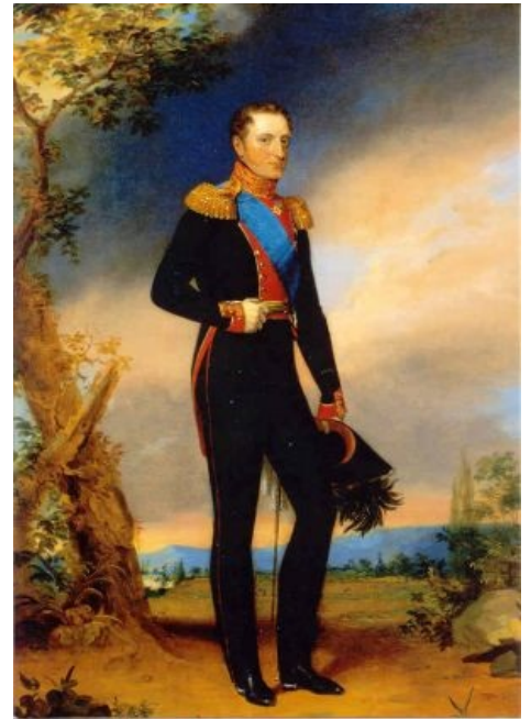
Николай, молодой и полный сил, приготовился вести Россию верным путём

«Россией управляет класс чиновников... и управляет часто наперекор воле монарха... Из недр своих канцелярий эти невидимые деспоты, эти пигмеи-тираны безнаказанно угнетают страну. И, как это ни звучит парадоксально, самодержец всероссийский часто замечает, что он вовсе не так всемогущ, как говорят, и с удивлением, в котором он боится сам себе признаться, видит, что власть его имеет предел. Этот предел положен ему бюрократией - силой, страшной повсюду, потому что злоупотребление ею именуется любовью к порядку, но особенно страшной в России. Когда видишь, как императорский абсолютизм подменяется бюрократической тиранией, содрогаешься за участь страны »