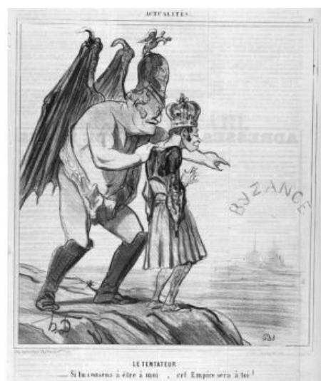
Большой и страшный Николай Павлович искушает греческого короля вступить в Крымскую войну

«Император русский, вмешиваясь в мелочи, часто компрометируется, но надобно войти в его положение: он приведен к убеждению, что во всей империи он - единственный честный человек... »