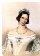
Если императрица и впрямь так выглядела, то неудивительно, что муженёк блядовал направо и налево