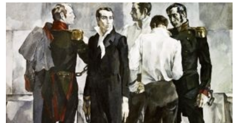
Пафосные декабристы. Сейчас их будут казнить

Собственно, декабристы подняли бучу не на пустом месте. С одной стороны, это было продолжением уже столетней российской традиции, национального вида спорта — со времён смерти Петра I гвардия организовала семь успешных и ряд фэйловых путчей, за что XVIII столетию историки приклеили название «эпохи дворцовых переворотов». С другой стороны, среди декабристов были уважаемы республиканские взгляды французского типа, в силу которых в одном из своих секретных манифестов заговорщики планировали не просто свергнуть монархию, но и выпилить августейшее семейство, а то и всех детей Павла I, на тот момент представлявших собой всю династию Романовых.