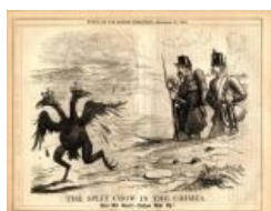
Двуглавая пташка после Севаса . Карикатура злобных англичашек.