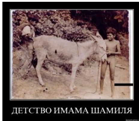
ДЕТСТВО ИМАМА ШАМИЛЯ

Не учившая историю школата развлекается такими демотиваторами