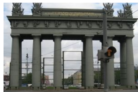
Исконно имперский способ тролить поляков «...за усмирение Польши»

1830 год. Малоизвестная у нас, для поляков это, естественно, трагическая и знаменательная дата, повод поскрипеть зубами на przeklętych Mongołokacarpów . Как всегда при русско-польских войнах, поляки хотели восстановления исторической справедливости — то есть не только освободить от русских свои исконно пшекские земли, но и прихватить назад Хохлянд с Бульбингемом, где, к слову пшеков хоть и не любили, но не против были присоединиться к зарубе . Тем более что при Александре Первом поляки жили как бы в своей независимой Польше, но и как бы в России — у них была своя армия, парламент и прочие плюшки независимой страны, но с русскими монархом, командующим армии и наместником от царя же. До поры до времени пшеки терпели такое положение, пока русская власть не решила начать потихоньку закручивать гайки — вводить цензуру и продвигать на денежные и важные должности всяких неместных дворян.