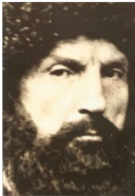
Шамиль, икона современных горцев

«Всем было известно, что весь Даргинский поход, под начальством Воронцова, в котором русские потеряли много убитых и раненых и несколько пушек, был постыдным событием, и потому если кто и говорил про этот поход при Воронцове, то говорил только в том смысле, в котором Воронцов написал донесение царю, то есть, что это был блестящий подвиг русских войск... а не ошибка, погубившая много людей. »