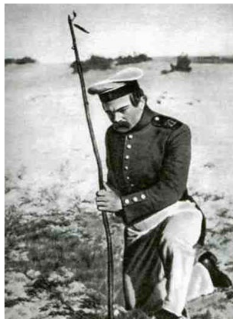
Киношный Шевченко страдает от репрессий царского режима

Обросшая легендами часть государственной канцелярии, которую Николай создал сразу после бунта декабристов, дабы впредь выявлять политически неблагонадёжных личностей и оперативно присылать за ними конные пативены . Формально III Отделение было обязано не только прочищать мозги всяким революционно настроенным юношам и молодым дворянам, но и ловить за потные ручонки взяточников и казнокрадов, а также следить за иностранцами. Ему был подчинён и созданный Отдельный корпус жандармов, сотрудники которого носили широко разрекламированный васильковый мундир. Каждый честный подданный мог спокойно прийти в отделение и настучать на кого нужно. Но на практике этому заведению лишь приписали мрачную славу кровавых чекистов и псов государевых, тогда как на самом деле спектр обязанностей ТО СЕИВК был широк, а кадров слишком мало для эффективной политической полиции. В подвалах Третьего отделения не расстреливали и не пытали в средневековом стиле, а только лишь вели вдумчивые беседы и гнобили психологически — ведь там работали мастера слова, а не кулака, отличившиеся передовыми методами гуманного дознания и следствия. Им удалось более-менее пригасить кухонную болтовню, но переловить взяточников, скажем, не вышло.