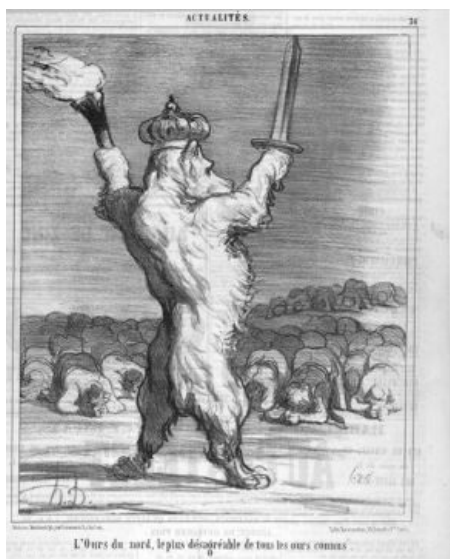
Царь и его подданные