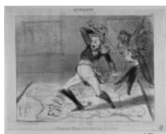
Государь негодует на Францию