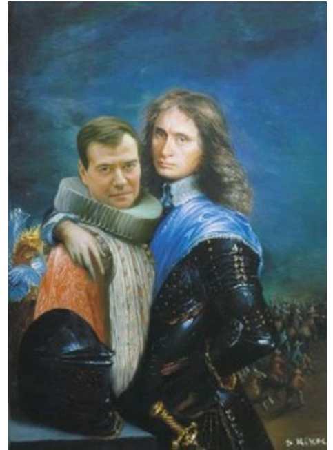
Ну вы поняли кто это

«А вообще, конечно, на полном серьезе заниматься критикой Никаса Сафронова — дело неблагодарное. Спасибо, что смешной, как говорится. »