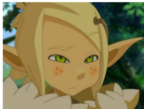
Wakfu. Сюжет развивается по законам классического сенена .