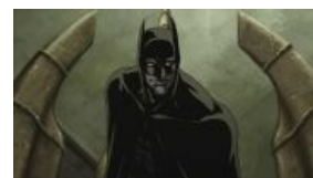
Анимешный Бэтмен ? Почему бы и нет.