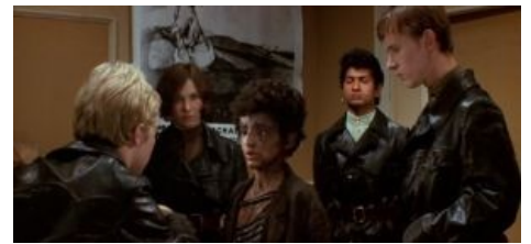
...и его личинка