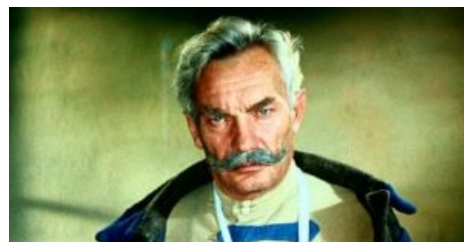
Лик и усы кровавой гэбни