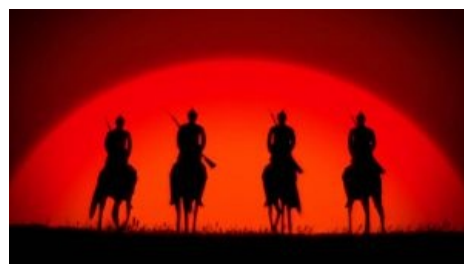
Четыре всадника Апокалипсиса на фоне красного рассвета

На выходе получился оглушительный вин . Школота, да и не только,