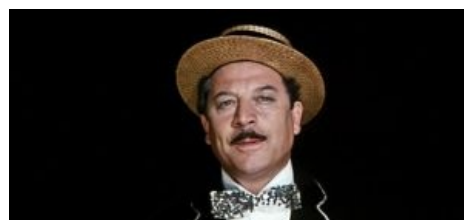
Я одессит, я из Одессы , здрасте!

«В первоначальном варианте Буба Касторский остается живым; я сказал Эдику, что хорошо было бы убить Бубу — это придаст фильму серьезность.