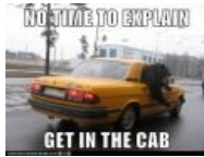
Ну ты понел...