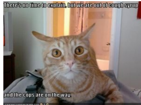
Самый первый известный макро с фразой, появившийся еще в 2009 году