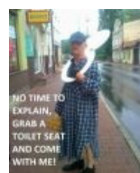
Хватай стульчак и беги со мной!