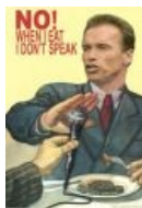
Арнольд Шварценеггер: «Когда я ем — я глух и нем!»