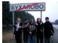
Косплей от «Арии»