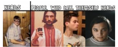
Ъ-нерды и позеры

праву считается одним из создателей специальной теории относительности , но также на его имя есть ещё 300 научных публикаций; кроме того, он первым по приколу предсказал квантовую телепортацию . Из ряда классических нердов, впрочем, несколько выпадает, так как имел отношения аж с двумя бабами, последняя из которых была его кузиной , и сына-физика от первой.