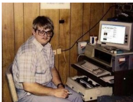
Сферический нерд в естественной среде обитания

Боевые Нерды встречались несколько раз в истории человечества, и не только в американских фантастических фильмах вроде « Супермена », но и в реалиях. Например, во время заседания кафедры биологии Алабамского университета женщина-преподаватель этой кафедры открыла стрельбу, в результате погибли трое человек, в основном профессора биологии, ещё трое ботаников получили ранения.