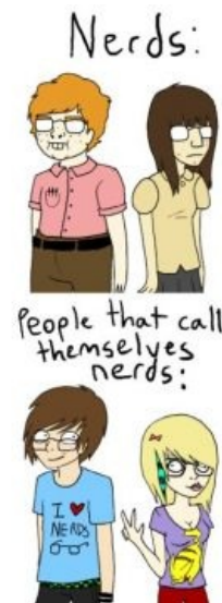
Ботаны супротив позёров