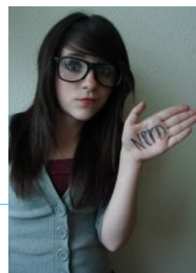
ТП, косящая под нерда