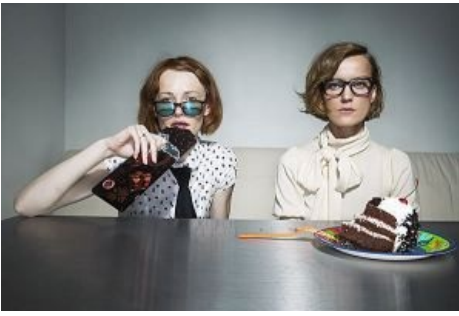
Nerd party. MOAR

так и остаётся в фантазиях, но если всё-таки боевому нерду сильно это впёрлось — он не обломается организовать покушение не хуже каких-нибудь зимбамбуйских недоспецслужб. И не сомневайтесь, если вы где-нибудь неподалеку услышали пиздец какой мощный взрыв, возможно даже ядерный, или внезапно заметили, как мимо вашего окна летит квадрокоптер со встроенным цифровым видеореги́стратором — будьте уверены, тут не обошлось без нердов. Трудно сказать, тянет Андерс Брейвик на нерда или это просто задрот , но факт того, что самым страшным оружием оказался его мозг, отрицать сложно. Помимо чисто технических познаний, адская тварь просчитала реакцию силовых структур на свои действия до последнего чиха, для чего обычно требуется превосходство в интеллекте в минимум 9000 раз. А это — на секундочку — ровно 50 раз по 180 IQ промеж одной пары ушей.