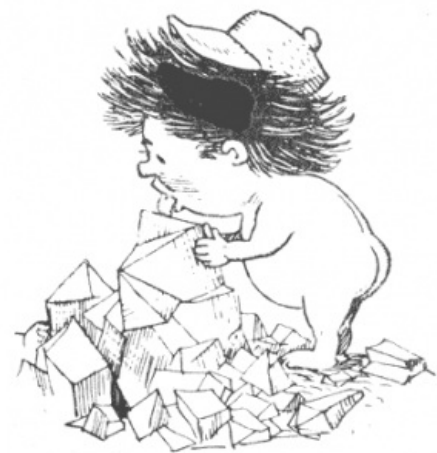
Пончик пробует товар

Казалось бы, до полной победы сил бобра над ослом осталось немного — напилить в столице под названием Давилон собственный ВДНХ с неременной статуей Рабочего и Колхозницы, но внезапно над Незнайкой нависает новая смертельная угроза — ностальгия. По понятным причинам обычное эмигрантское лекарство (флакон «Столичной» в брайтонском кабаке под хриплый вокал Шуфутинского) не проканаает, поэтому принимается решение срочно возвращаться домой, на социалистическую Родину. Что и реализуется незамедлительно под бурные аплодисменты лунатиков (пообещавших далее самостоятельно следовать заветам Знайки-Ильича), переходящие в овации... а также несмотря на то, что по пути у главгероя фиксируется чуть ли не