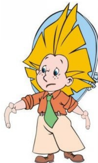
«Новый» Незнайка. Сферическая хуита в космическом вакууме