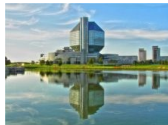
Проба цифровухи. Пример неудачный

Национальная Библиотека ( шарик Шурика, кубик-рубик, чупа-чупс, бактериофаг, блевотека, Звезда Смерти, аналка, шарик-дурик ) — огромных размеров развлекательный комплекс в Минске , в состав которого входят рестораны, фитнес-клубы, бассейны, блекджек, шлюхи, конференц-залы и кафе — всё необходимое для повышения уровня образования граждан. В подсобных помещениях комплекса надёжно спрятано никому не доступное книгохранилище и сокровищница для Национального Достояния Беларуси™. Комплекс введён в эксплуатацию в 2006 году.