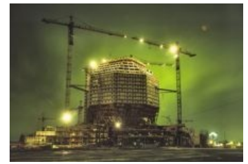
Нечто вылезло по зову Предков

А ещё библиотека смотрелась бы лучше, если бы строители не обратились к одной славной компании-поставщику стёкол, которая, смекнув объёмы профита, обещала отражающие стекла [3] , а привезла обычные — таким же образом наебали и реконструкторов национального аэропорта «Минск».