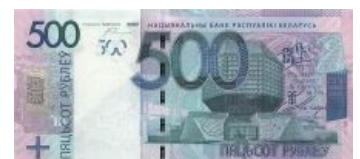
Сабж на новых белорусских деньгах

К тому же, рядом с этим чудом белорусских советских архитекторов по средам регулярно проходила самая крупная сходка в Минске под гордым названием «Коряга». Вообще это было место сбора всякой неформальной молодёжи, с целью попить пива, снять готёлку, послушать народную музыку. Рядом ещё проходили сходки ныне почившего портала metalfont.org , где был редкостный трэш и угар — пиво в полторахах, песни Тсоя и металлики под расстроенную гитару в атмосфере всеобщего веселья. Такие вот волосатые места . Но теперь всему настал пиздец — последнюю