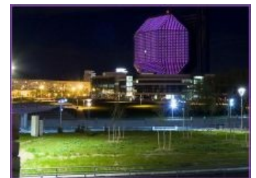
Глюкогенная часть скринсейвера (битых пикселей хоть отбавляй)

На ночь админ запускает примитивный скринсейвер, и библиотека начинает показывать все чудеса гиф -анимации. Если вначале рекламы почти не было, то теперь она занимает больше половины скринсейвера. Рекламируют многое: саму библиотеку, Стабильность™, пожарные извещатели, сотовых операторов и прокладки, службу Паулика в армейке, туалетную бумагу и средства от выпадения волос. Вторую часть времени занимает глюкогеника, которая вполне сойдёт для просмотра под веществами .