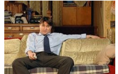
Каноничный образ настоящего мужыка в домашней обстановке

«Но если не выполняет свои мужские обязанности (нет, конечно, никто никому ничего не обязан, мы в свободной стране), то это не мужчина. Но, опять же, очень хочу подчеркнуть, все обязанности принимаются на себя исключительно мужчиной, исключительно добровольно и исключительно потому, что он мужчина, а значит, обязан принимать решения, хотя может и не принимать решения, потому что это его право, но настоящий мужчина всегда принимает решение и несёт за него ответственность, но он не обязан, просто он всегда так делает. Это признак настоящего мужчины. »