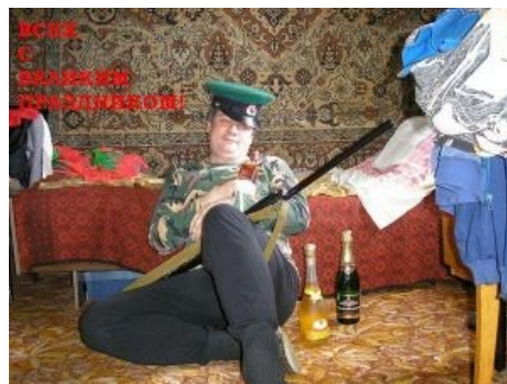
Совсем конченный вариант. На фоне ковра . И горизонт, как водится, завален — всяким мужыцким барахлом ...