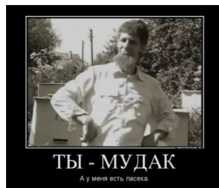
Ливер и пчелки

Творчество НОМ характеризуется иронично-глумливым взглядом на вещи и чуть более чем значительной долей абсурда. Некоторые называют НОМ русским «The Residents» и Monty Python .